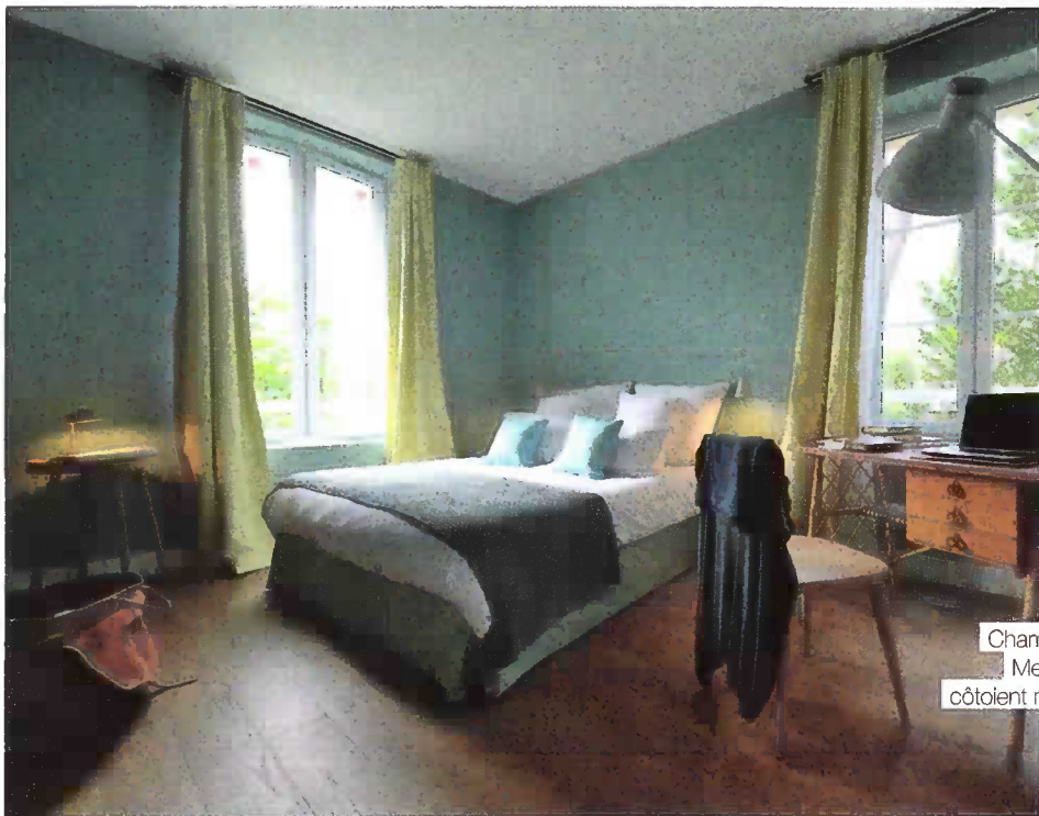
Chambre Meuble côté droit